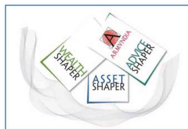
Armundia serie Shaper, le soluzioni per il mercato Finanza

La filosofia architeturale degli Shaper parte da una piattaforma di nuova con-